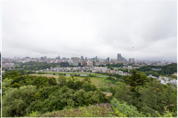
本店のある仙台市