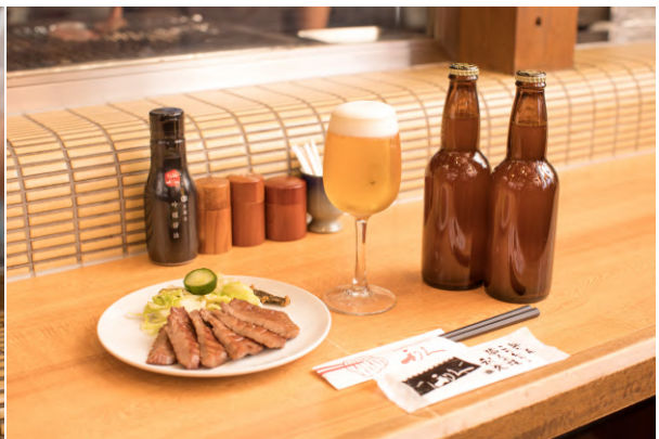
「希望の丘」のイメージ