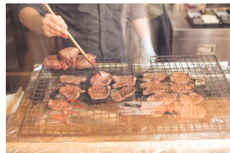
提供される牛たん