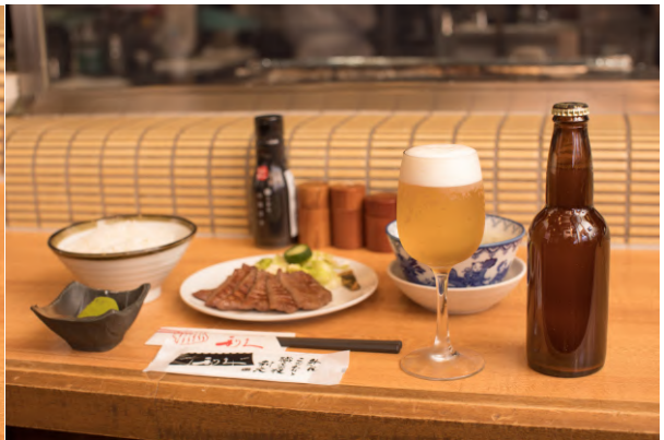
「希望の丘」のイメージ② ※店舗での提供を想定して撮影