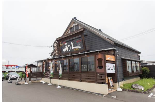
利久が展開する「牛たん炭焼 利久 岩沼店」の外観

所在地：宮城県岩沼市吹上二丁目2番 36-1号 従業員：2,000名 代表者：亀井利二