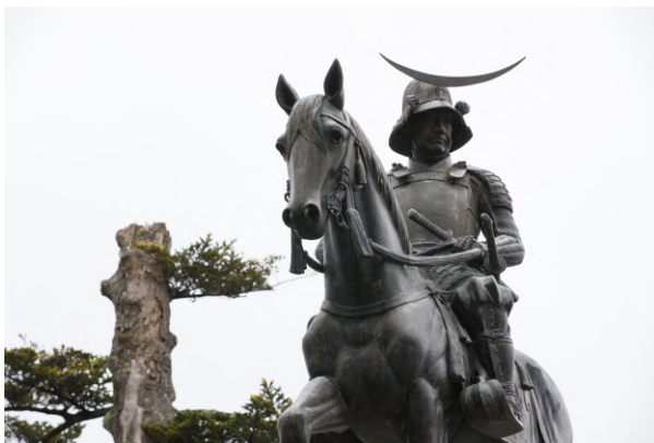
仙台市で有名な伊達政宗像